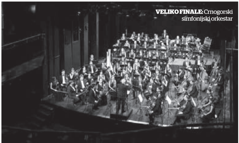
VELIKO FINALE: Crnogorski simfonijski orkestar

Koncert koji nosi naziv „Deveta u čast Desete“ posvećen je deceniji od obnavljanja crnogorske nezavisnosti. R.K.