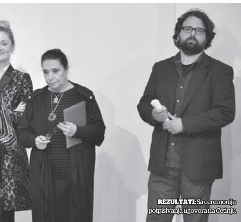
REZULTAT: Sa ceremonije potpisivanja ugovora na Cetinju

novih, zanimljivih autora iz domena poezije. Prvi put su podržana dva elektronska časopisa, koji mogu biti važni. Jedan je „Proleter“, a drugi „Peripetija“. Prvi put je podržan i jedan naučni časopis – „Lingva Montenegrina“ - ka