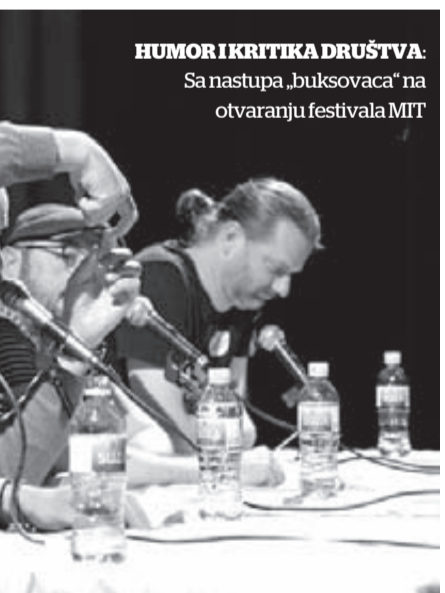
HUMOR I KRITIKA DRUŠTVA: Sa nastupa „buksovaca“ na otvaranju festivala MIT