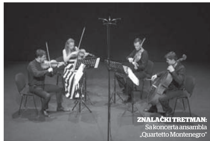
ZNALAČKI TRETMAN: Sa koncerta ansambla „Quartetto Montenegro“

Za prvi nastup izabrali su panoramski koncipiran program koji obuhvata djela različitih epoha i stilova, od Jozefa Hajdna koji je jedan od utemeljivača žanra gudačkog kvarteta, preko kompozicija romantičara,